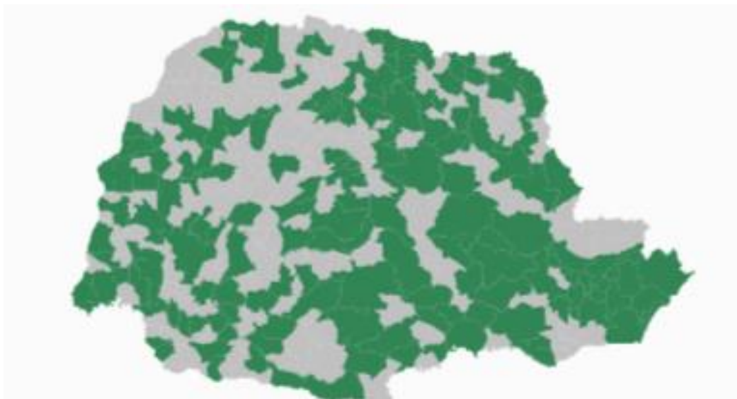
Imagem 1 – Municípios que ofertam Educação Profissional na Rede Estadual do Paraná na Etapa do Ensino Médio