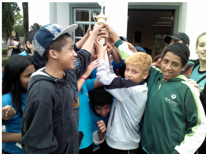
Colégio Elias Abrahão – Quatro Barras

O Colégio Estadual Elias Abrahão, em Quatro Barras, venceu a gincana, seguido da Escola Estadual Luarlindo dos Reis Borges e do Colégio Estadual Tenente Sprenger, ambos em Pinhais. As escolas ganharam troféus pela pontuação obtida durante os quatro dias de