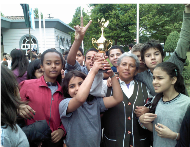
Colégio Luarlindo dos Reis Borges