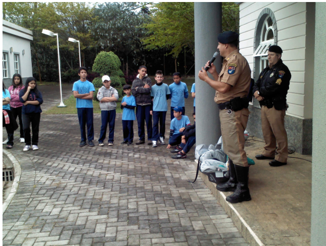
Grupo da Polícia Militar dando dicas de segurança no trânsito para os alunos da Vila.